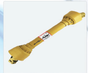
Toma de Fuerza